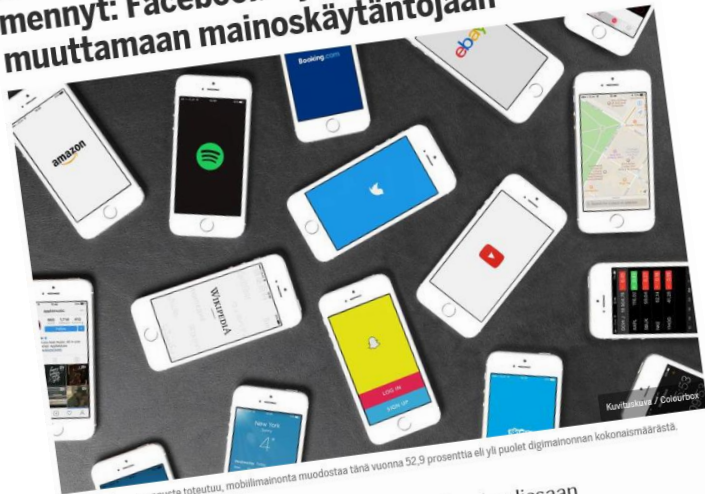
Mikali eMarketerin ennuste toteutuu, mobiilimainonta muodostaa tänä vuonna 52,9 prosenttia eli yli puolet digimainonnan kokonaismäärästä.

Kansainväliset suuret nettipalvelut ovat olleet huolissaan eurooppalaisen tietosuojalain vaikutuksista – eivät suotta. Valituksia väärinkäytöksistä on esitetty heti lain voimaantulon ensimmäisenä vaikutuspäivänä.